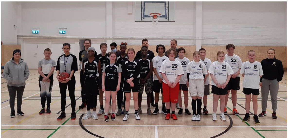
Kuva 1. Hongan nuoret harjoitusottelun jälkeen 10.4.2021.